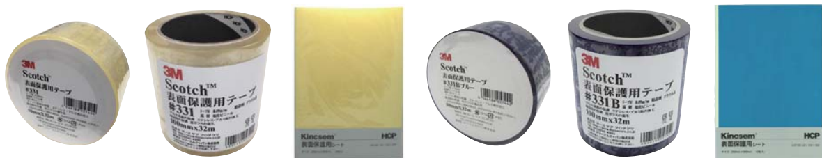
331 50×32 331 100×32 331 200×300 331B 50×32 ブルー 331B 100×32 ブルー 331B 200×300 ブルー

●テープ厚:0.09mm ●粘着剤:アクリル系 ●基材:塩化ビニールフィルム ●テープ色:透明・ブルー